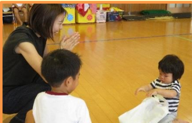
プレゼント (未就園児)