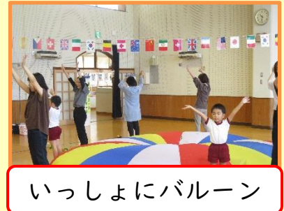
いっしょにバルーン

【保護者から】●「大勢の大人に見守られ緊張した顔をしていましたが、だんだん笑顔が見られ楽しそうな姿にほっとしました。どの競技も全力で頑張っていて、お友達にも声をかけて、さすが年長さんだと思いました。地域の方々に温かく見守っていただき、親としても嬉しかったです。ありがとうございました。●「兄にがんばったねと言ってもらい、嬉しそうでした。次のつくしんぼの会が楽しみです。●「子どもたちの成長が感じられ、家族も一緒に参加させてもらって、少人数園ならではの和気あいあいとした運動会でした。(中略) 恥ずかしがりやだったのが、みんなの皆の前でプログラムの放送もできてびっくりしました。(中略) 日々成長する姿に嬉しくもあり寂しくもあり、今回の運動会を通して、また皆がひとまわり大きくなったと思います。