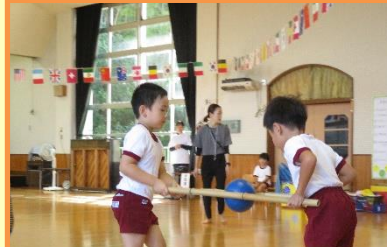
ちからをあわせて！えいえいおー！