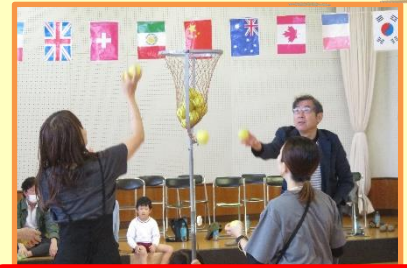
玉入れ(全園児、来賓、祖父母)