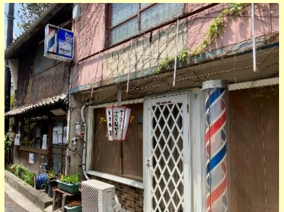
「温泉津の町並み」 (令和5年5月)

ひと回りしもう一度あの場所に帰りましたが、坂の上におばちゃんを見ることはありませんでした。距離にして15メートル、わずか5秒間のドラマでした。