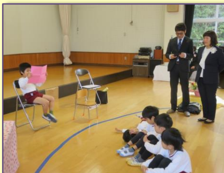
年中組に メッセージを贈る