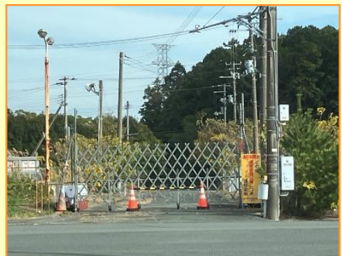
この先帰還困難区域