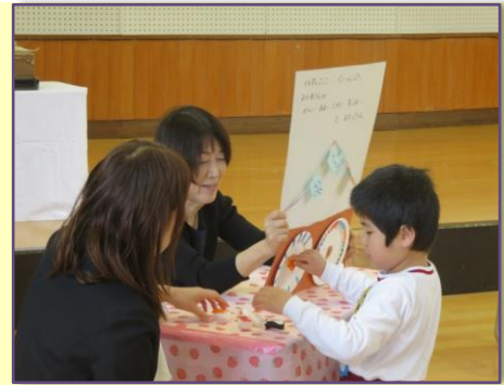
思い出のつまった 手作り絵本を披露