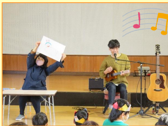
ひうたさんのコンサート