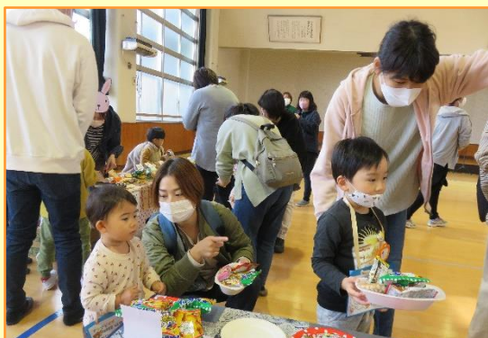
お菓子屋本舗 (本物のお菓子がたくさん)