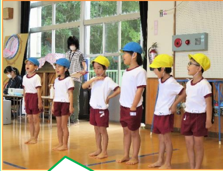
元気よく開会宣言 (年長組)