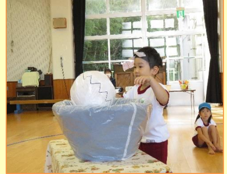
親子フォークダンス