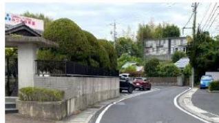
▲①【みつき保育園前】カーブがあるので前方が見えにくく白線の幅が狭いので前後からくる車に注意