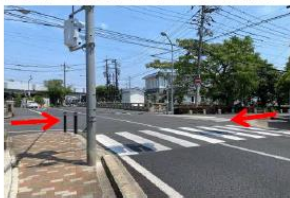
▲⑤の極細道必ず「とまれ」の標識で止まり、車、バイク、自転車が来ないか確認！