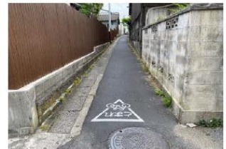
▲②【みつき保育園前の細道】自転車やバイクの飛び出しに要注意