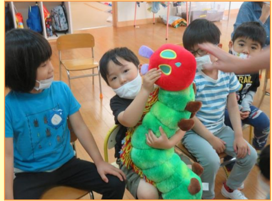
大型絵本「はらぺこあおむし」の読み語り。ぬいぐるみも登場。