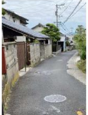
▲④売豆紀神社から下りの坂道。車のスピードが出ている。