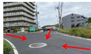
▲③三方から車が来るので車・自転車・歩行者ともに注意が必要