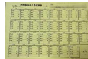
大野版るるくる記録表

るるくる記録表を大野公民館で配布しています。 記入されたるるくる記録表等を、まめなかサロンに持ってきていただくとささやかなプレゼントをお渡しします♪ 保健師と一緒に振り返りをしましょう!