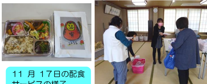
11月17日の配食サービスの様子

12月22日(水) の配食サービスは、午後から対象者のお宅へ福祉推進員がケーキをお届けします！ お楽しみに(´▽`)