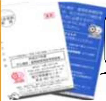
がん検診・歯周病 検診等受診券の 見本