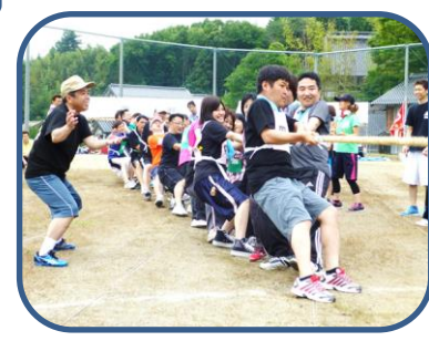
みんなで力を合わせて!