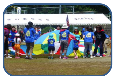
**おめでとうございます** 大野幼稚園創立50周年