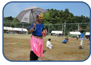
↑ わたしは、だれでしょう？