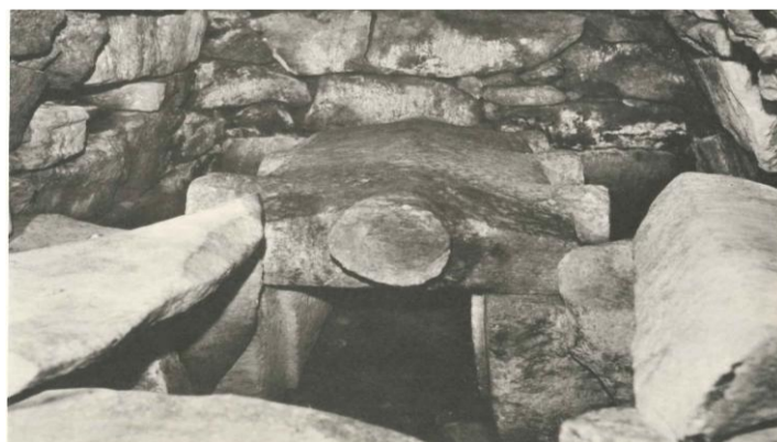
写真 岡田山1号墳の家形石棺

岡田山1号墳の横穴式石室の中には、家形石棺と呼ばれる石で作られた棺桶が収められています。蓋の部分の家形の加工されています。正面と側面には縄掛突起(なわかけとつき)と呼ばれるでっぱりがあります。石棺の身の部分の正面側は石がなく開いています。この家形石棺内部は長さ1.15m、幅0.35m、深さ0.4mしかなく、非常に小さなものです。当時の人は今より小柄だと考えられていますが、それでも大人が入るのは難しいサイズです。ヤマトなどにいて亡くなって骨になってから葬られたなど、諸説ありますが、現在骨が残されていないので詳細な検討は難しいところです。