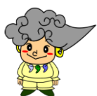
八雲立つ風土記の丘 YAKUMOTATSU FUDOKINOOKA

日時: 8月9日(土) 14:00~16:00 講師: 深澤太郎氏(國學院大學博物館教授)