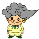
八雲立つ風土記の丘 YAKUMOTATSU FUDOKINOOKA