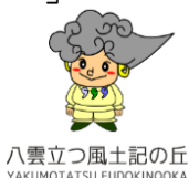
八雲立つ風土記の丘 YAKUMOTATSU FUDOKINGOKA