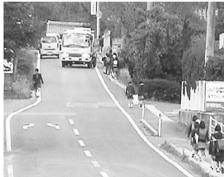
平成12年ごろの JAくにびき大庭店付近の様子

私は完成した危険箇所マップに従って自転車で回り、その場所をカメラに収めていきました。危険を感じた箇所は数え切れませんでしたし、中には対向車が来た場合、路側帯をはみ出さないと車同士がすれ違うことが出来ない場所があることもわかりました。