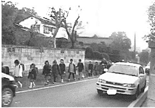
平成12年ごろの 中の島十字路付近の様子

写真を整理し発表原稿が完成すると平成13年1月30日19:00～大庭小学校視聴覚室（現在の多目的室）において、『第一回通学路を考える会』を開催するに至ったのです。二回目は平成13年6月25日に開催したのですが、主張した道路の拡幅整備については、地権者の方々の様々なお考えがあることが分かり、私は天を仰ぎこの活動から身を引いたのです。