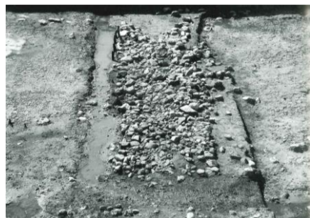
図 杭や石で作られた道路状遺構

そのため自然河道が確認されていますが、弥生時代後期や、奈良・平安時代、中世などさまざまな時代の遺構や遺物が見つかっています。古墳時代後期の溝からは、須恵器や土師器とともに、建築部材や容器などの、さまざまな木製品が見つかっています。また自然科学分析によって、奈良・平安時代にも近くで水田耕作が行われていた可能性が指摘されています。また明治以前の道の道路状の遺構も確認されています。現在では多くの車が行きかい、姿が大きく変わりました。