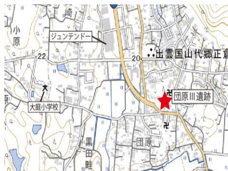
図1 団原Ⅲ遺跡位置図

特に旧石器時代の石器は、台形様石器と呼ばれる石器で、長さ3.76cmのものです。刃部には使用痕が残っていることから、狩猟用の槍先として使用されたと考えられます。県内では旧石器時代の遺跡は68ヶ所見つかっていますが、このうち8ヶ所は団原Ⅲ遺跡のある台地周辺にまとまっています。この台地上を旧石器人が拠点として活動していたことがうかがえます。