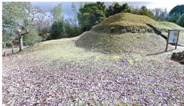
図：岡田山1号墳と6号墳

このように、岡田山古墳群には1～7号が確認されていますが、近年さらに南側にも丸い墳丘状の高まりが2ヶ所確認されており、今後の調査で8・9号墳が明らかになるかもしれません。