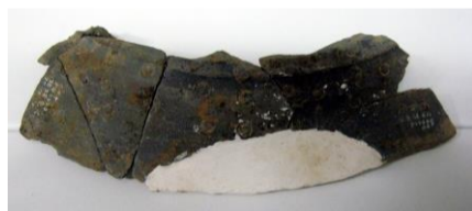
岩屋後古墳の皮袋形須恵器

このような特殊な須恵器が、大庭の大型古墳に集中して見られる点は注目されます。いずれも全体が残っていませんが、貴重な出土遺物です。