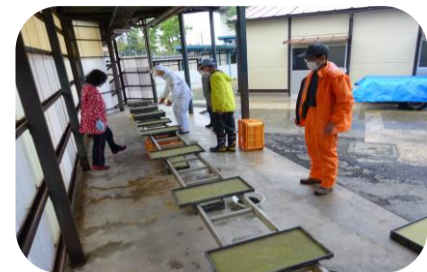
協力員の皆様ご指導のほどよろしくお願いいたします。