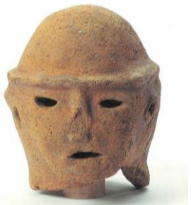
岩屋後古墳の人物埴輪

男性の埴輪と考えられ、右耳の後ろに盛り上がった部分が残ることから、みずらという髪型の表現があったと推測されます。岩屋後古墳の埴輪は、奥出雲町常楽寺古墳の埴輪との共通点があり、同じように両手を前に出し何かを捧げ持つ巫女埴輪や、帽子をかぶる男性の人物埴輪などが見つかっています。他に馬埴輪も両者で見つかっており、表現手法に共通点が見られます。