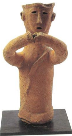
図 岩屋後古墳の人物埴輪

岩屋後古墳からは4体の人物埴輪がみつかっており、これまでに2体を紹介しました。今回は両手を前に出している人物を紹介いたします。耳が環状につくられているので、これは環状の耳飾りの表現と考えられます。女性の埴輪と考えられ、髪型は板状につくられています。頭頂部がへこんでおり、頭の上に何かのせられていた可能性がります。鼻筋が通り、目、口ともに明瞭で柔らかな表情を見せています。両手を前に出して、何かを捧げ持つような姿をしています。巫女がこのような姿でつくれる場合、器を持つ場合が多いので、この埴輪も器を持っていたのかもしれない。