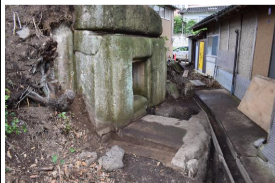
写真：調査時の石室状況

山代原古墳の石棺式石室は、近年の発掘調査によって、前庭部分の構造が明らかになりました。丁寧に加工されキッチリと組み合わせで作られていることが分かります。