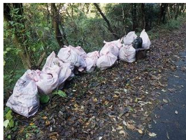
<撤去作業により回収されたごみ>

松江市廃棄物適正処理対策推進事業の一環として西持田町日吉地区にある林道深町線が令和5年度の不法投棄重点監視地域に指定され、地元から不法投棄防止合同パトロール及び投棄物の撤去作業が行われました。また、今後の不法投棄防止に向けた啓発看板・監視カメラが設置されました。