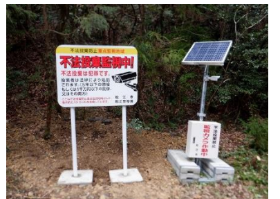
<啓発看板・監視カメラ>