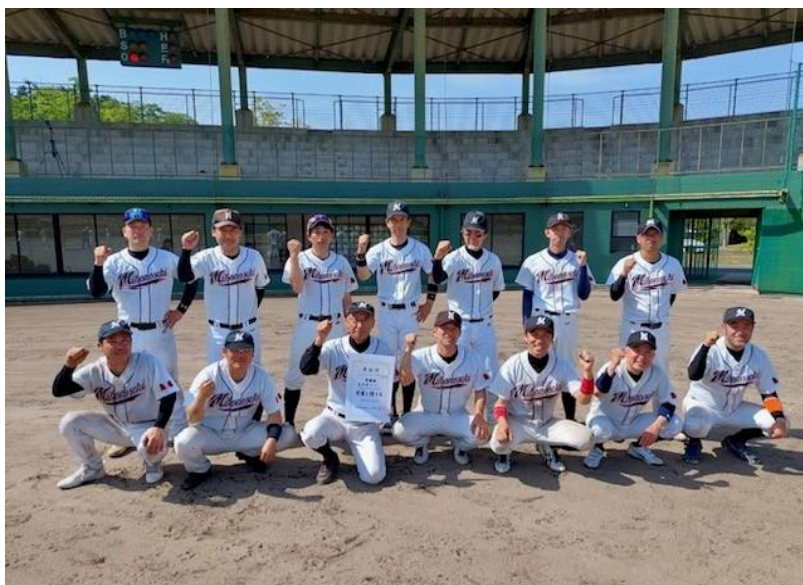
2023 日本スポーツマスターズ県大会準優勝時の写真