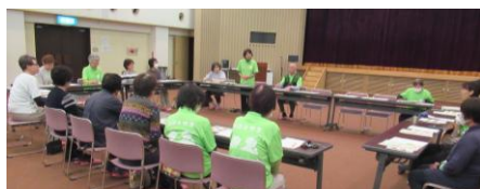
チャレンジヘルス美保関委員会