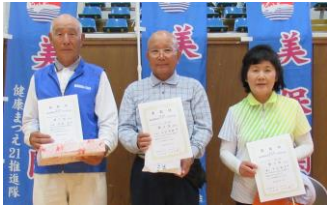
[グラウンドゴルフ]

6月23日(日)美保関公民館・体育館・総合運動公園運動場を会場に216名の参加者が一堂に集まり、スポーツを通じた健康づくりや交流・親睦を図り、元気で明るいまちづくりにつなげることを目的とした町民スポーツ交流大会がありました。小学生から高校生、高齢者まで三種の競技で楽しく熱戦を繰り広げました。(敬称略)