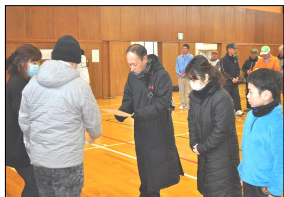
森山Aチームのみなさん