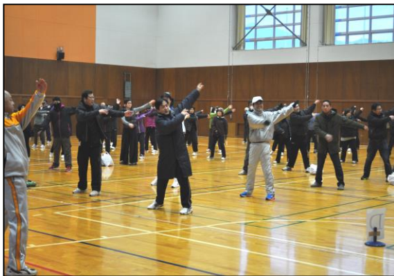
ラジオ体操で準備運動 協力 健康まつえ21 美保関推進隊