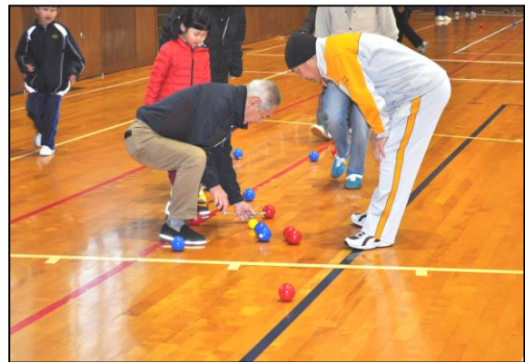
どれがいちばん近いか