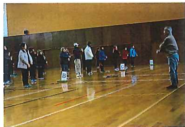
ラジオ体操で準備運動 協力 健康まっえ 21 美保関推進隊