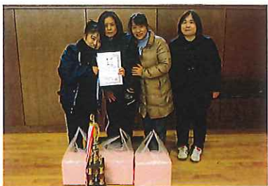
七類Aチームのみなさん