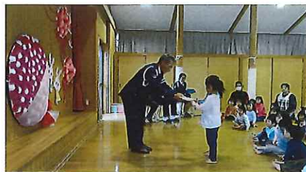
美保関東保育所の園児たち