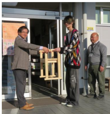
▲ 松江工業高校定時制の生徒から寄贈された椅子を受け取る公民館長=3月16日、公民館玄関