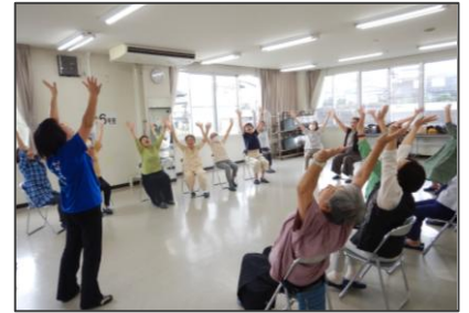
▲令和7年度「笑いヨガ」の様子