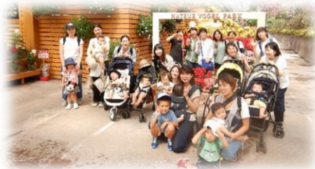
遠足 フォーゲルパーク