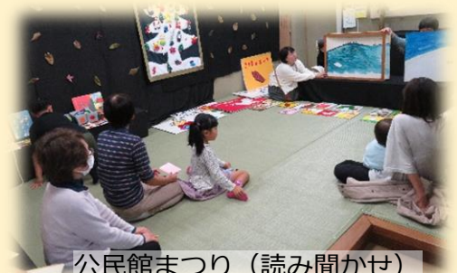
公民館まつり (読み聞かせ)

毎週月曜日(祝日はお休み) 15:00~17:00 月1回土曜日(主に第1週目) 10:00~11:30 会 場 古志原公民館 2階 図書室