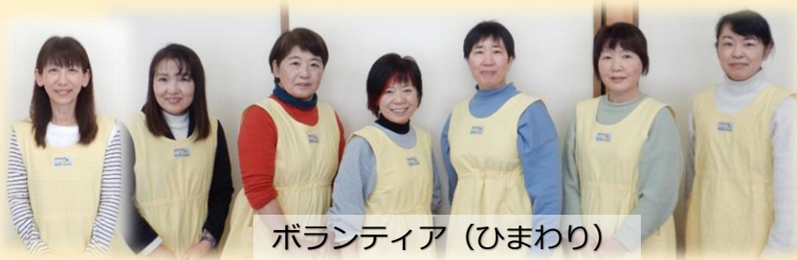
ボランティア (ひまわり)