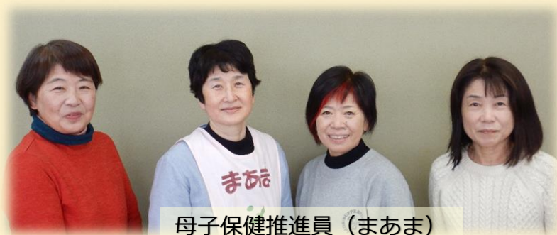
母子保健推進員（まあま）