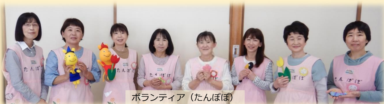
ボランティア（たんぼぼ）