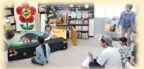
公民館まつり (読み聞かせ)