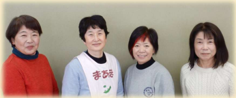
母子保健推進員（まあま）