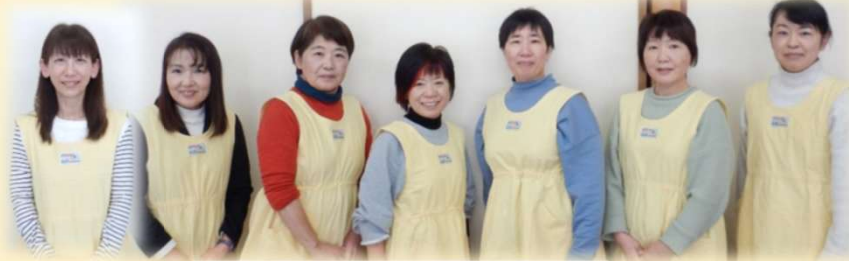
ボランティア (ひまわり)