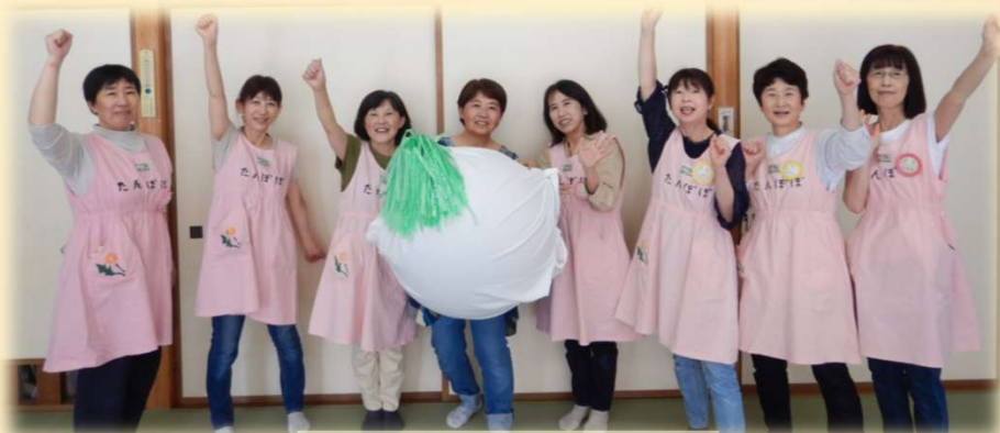
ボランティア（たんぽぽ）