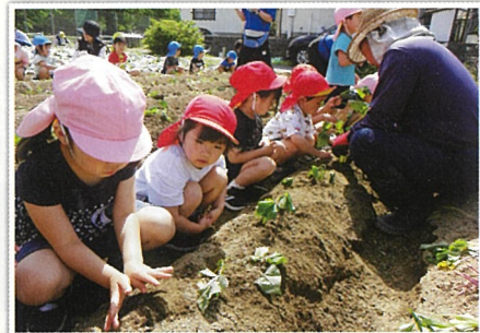
川津幼稚園のみなさんと苗植え