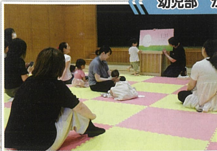
図書館ボランティアさんの読み聞かせ