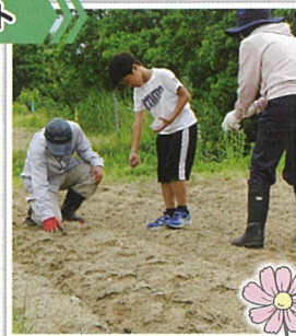
コスモスの種まき