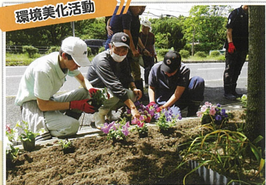
松江養護学校Mファームの皆さんと花壇の植え替え