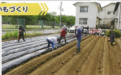
畝立て、マルチはり