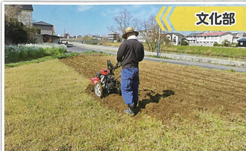
いも畑の荒起こし