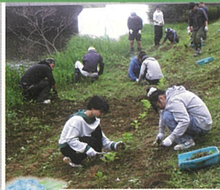
あじさいの間の草取り