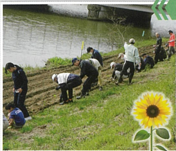
ひまわりの種まき