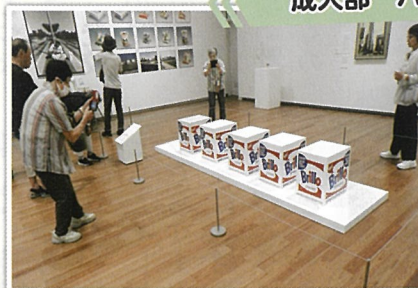
鳥取県立美術館 プリロの箱