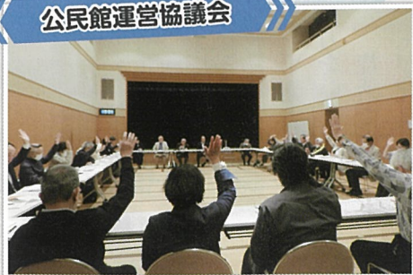
今年度の事業計画を決めました