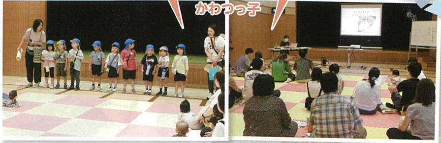
幼稚園のおともだちが来てくれました (5月)