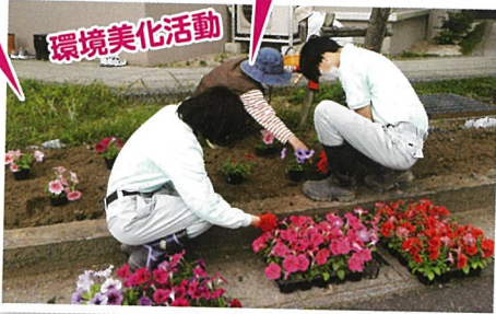
松江養護学校高等部「Mファーム」の 皆さんと花植え (5月)