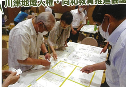
研修会「避難所運営ゲーム (HUG)」 (6月)