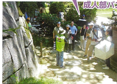
後楽園までは分割して運ばれた 慈眼堂の烏帽子岩