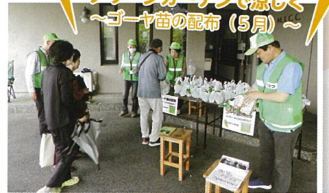
グリーンカーテンで涼しく ～ゴーヤ苗の配布 (5月)～