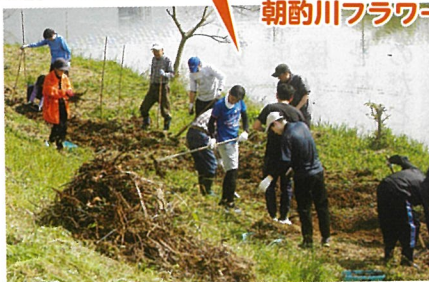
あじさい畑づくり (4月)