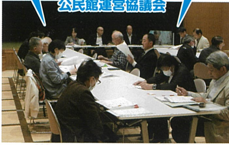
今年度の計画を決定 (4月)