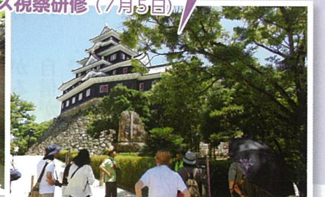
別名烏城とも呼ばれる岡山城天守を北側から