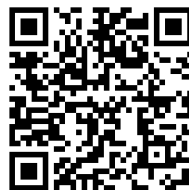
松江地方法務局ホームページのQRコード