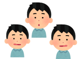
《口腔体操のイメージ》