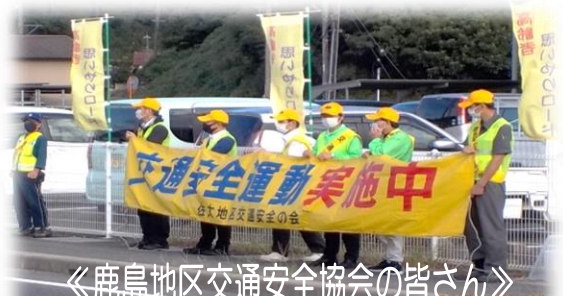
《鹿島地区交通安全協会の皆さん》