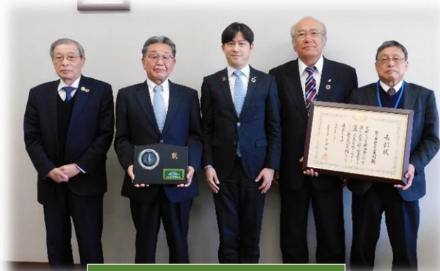
《市長表敬訪問の様子》

また3月16日には、「松江地区社会教育委員連絡協議会 研修会」が行われ、「合言葉は「オール鹿島」！公民館からひとつり・地域づくりへ」と題し、鹿島公民館の概要や特徴ある活動・課題について、発表させていただきました。