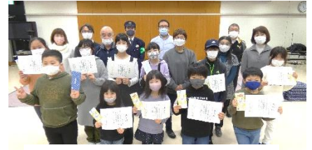
お手伝い頂きましたスタッフの皆様ありがとうございました。