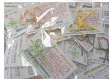
表が「口」、裏が「十」で、願いが叶う「叶結び」(かのうむすび)で作られています。