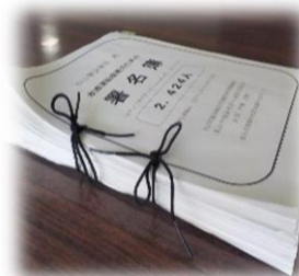
《飲酒運転 根絶署名簿》

鹿島地区の皆さまには、署名運動にご協力をいただき、大変ありがとうございました。今後とも、交通安全の推進につきまして、ご理解とご協力をお願いいたします。