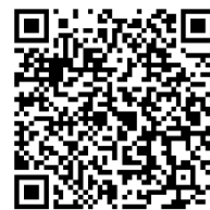
申込み QR コード