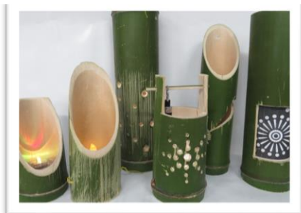
【A】 竹の香り・やさしい光… 「竹行灯」

今年の夏休みは、おとうさん・おかあさん、おじいさん・おばあさんと一緒に工作を楽しもう!