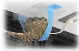
追伸 お陰様で6/17ヒナは無事巣立ちました

下を通る皆さんの思いが一つになり、奇跡のツバメに声援を送る城西公民館の初夏でした。