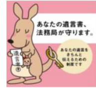
あなたの遺言書、 法務局が守ります。