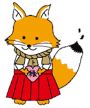
松江地方法務局不動産登記推進 イメージキャラクター 「縁結びトウキツネ」