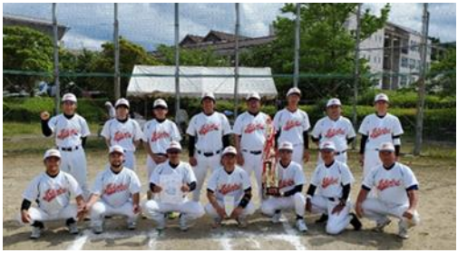
城北チーム<Aグループ> 優勝 おめでとう!

6月11日(日)「第53回 市民体育祭松江市ソフトボール大会」が4年ぶりに開催されました。Aグループは美保関総合運動公園で、10チームが対戦。城北チームは見事、優勝を果たしました。