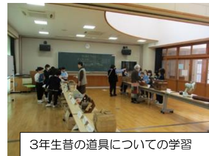
3年生昔の道具についての学習

この1年間、城北小学校はとてまたくさんの地域の方、保護者の方に支えていただきました。地域コーディネーターさんが集計してくださったところ、学習活動の支援や図書館活動、環境整備や登下校時の見守り活動など、本年度年間延べ人数で2000人を