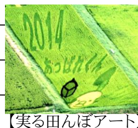
【実る田んぼアート】