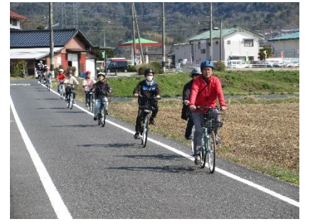
3/21 サイクリング教室