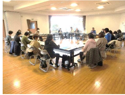
2/24 福祉推進員連絡会