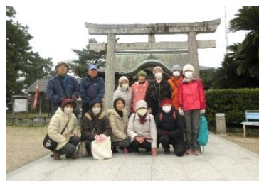
2/16 いきいきウォーキング