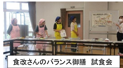
食改さんのバランス御膳 試食会