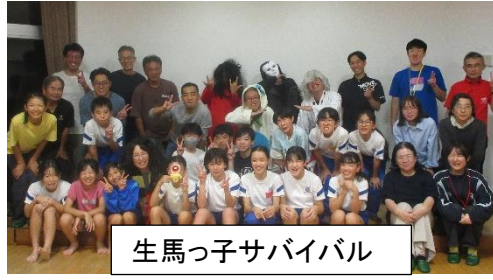
生馬っ子サバイバル