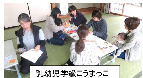
乳幼児学級こうまっこ