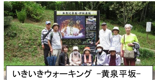
いきいきウォーキング-黄泉平坂-