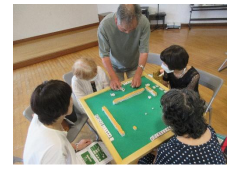
7/10(木) 第1回健康マージャン