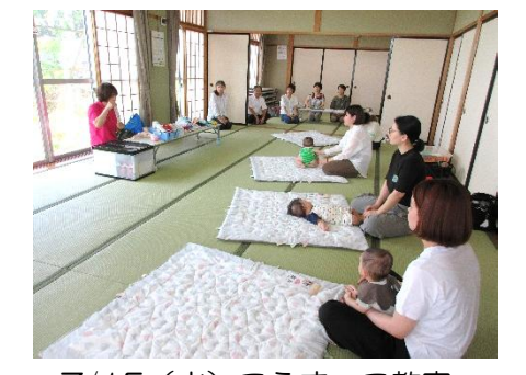
7/15(火) こうまっこ教室