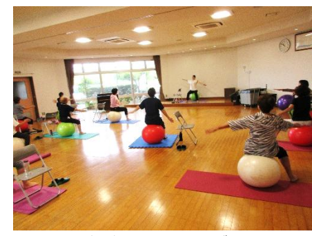
7/14(月) バランスボール体験