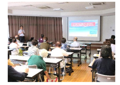
7/17(木) まるごと元気研修会