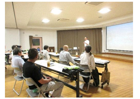
7/2(水) 環境保全協力員研修会