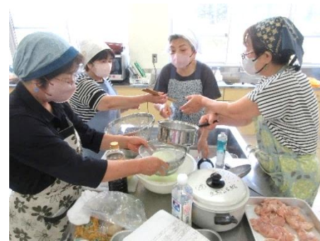
6/30(月) 成人学級「乳和食」