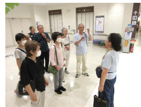
7/9(水) いきいきウォーキング